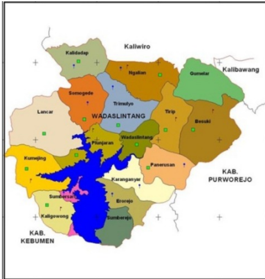
Peta Kecamatan Wadaslintang